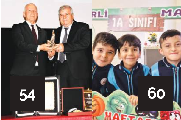
TDAV Vakfımızdan Haberler