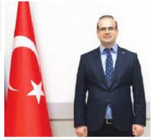
Anabilim Dalı Başkanı

Sakarya Üniversitesi Muhasebe ve Maliye Bölümü mezunu olup, 2008 yılı itibarıyla Türk Dünyası İktisat Fakültesi Öğretim Üyesidir. 2003 yılından beri Bölüm Başkanlığı görevini yürütmektedir.